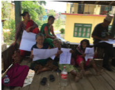
शिव शिवा, २०१६, पृष्ठ १०१