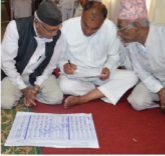
श्री १९ को संविधान संशोधन